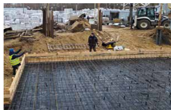
В Коломне завершился масштабный инвестиционный проект, превративший идею в реальность, а десятки тонн металла – в сердце нового современного производственного комплекса.

Затем под пристальным вниманием инженеров начался монтаж оборудования: фильтра аспирации для сохранения чистоты воздуха и сушильного барабана – сердца всего комплекса. Параллельно с электромонтажом был запущен монтаж газовой горелки. Уже к 10 февраля сборка конструк-